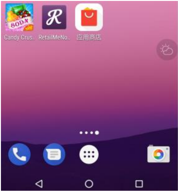
图 4-2 控件示例

注：在 android sdk 23 以上，需要用户手动开启悬浮窗权限，才能正确运行本功能。